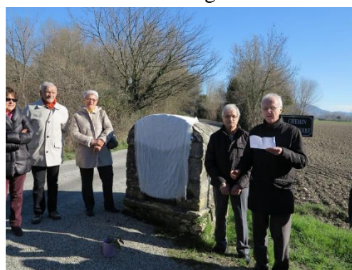
Allocution du maire